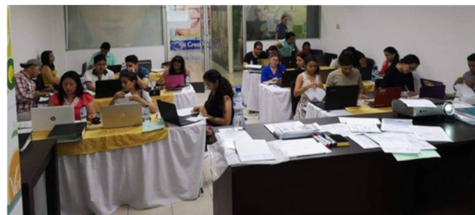
Estos son nuestros Laboratorios