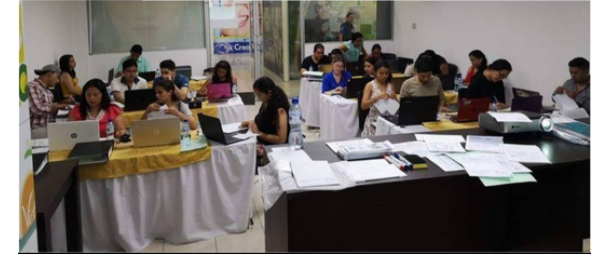
Estos son nuestros Laboratorios